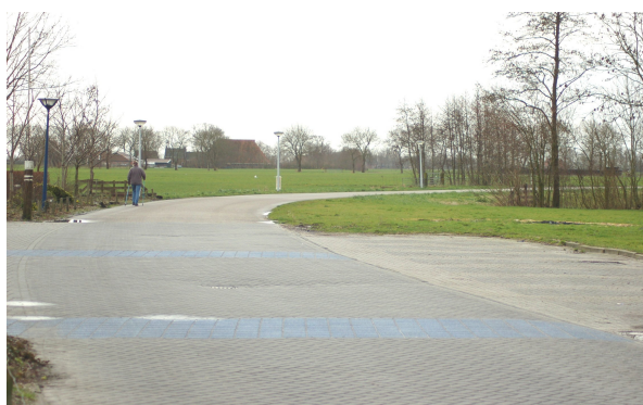
Om 'e Terp