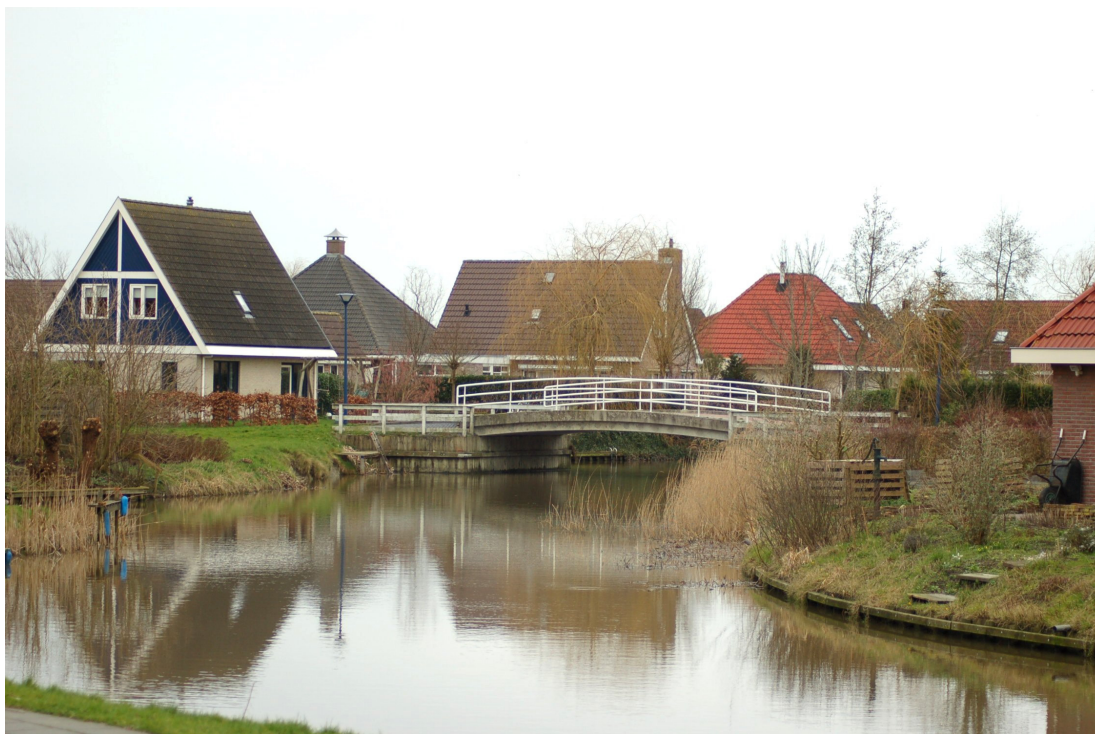
Een aantrekkelijke woonomgeving