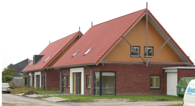
Nieuwbouw in Mantgum

Er zijn volop ontwikkelingskansen voor Mantgum want ons dorp is een treinkern en één van de groeikernen van Littenseradiel.