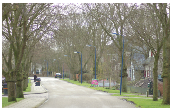
Seerp van Galema wei