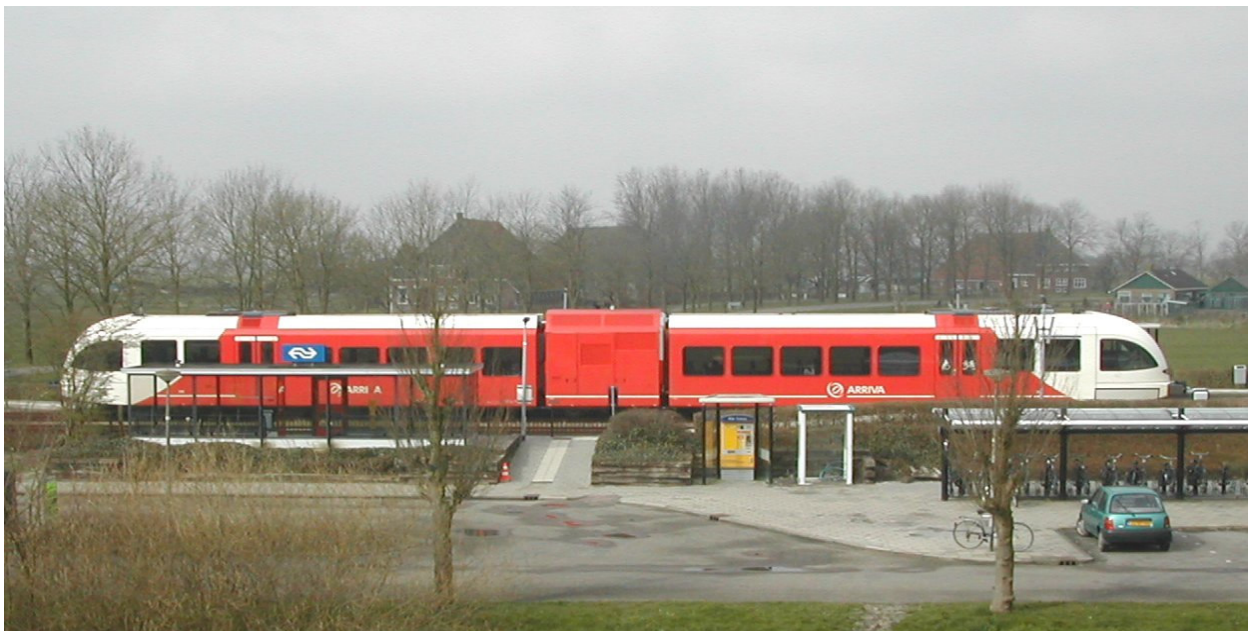
De "Spurt" , de nieuwe Arriva trein