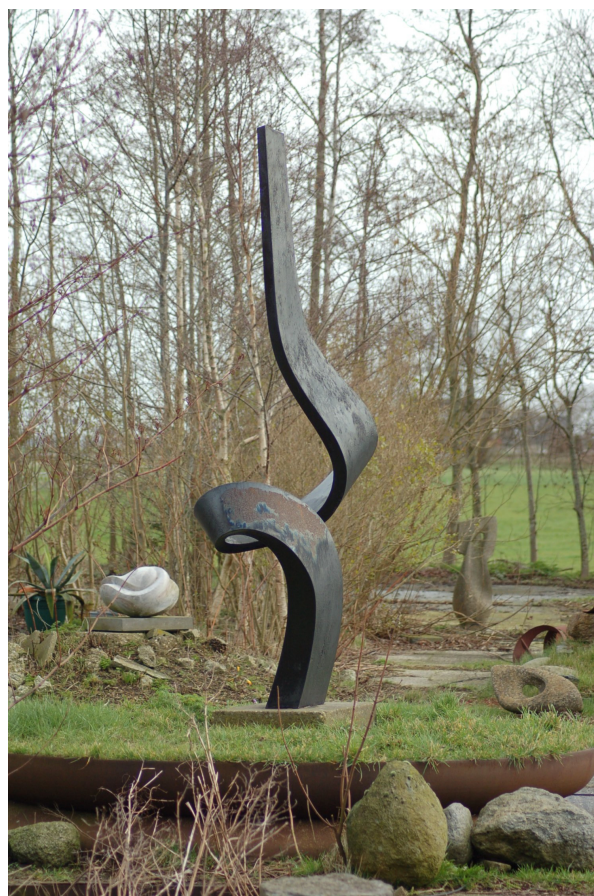
Kunstwerk van Hein Mader